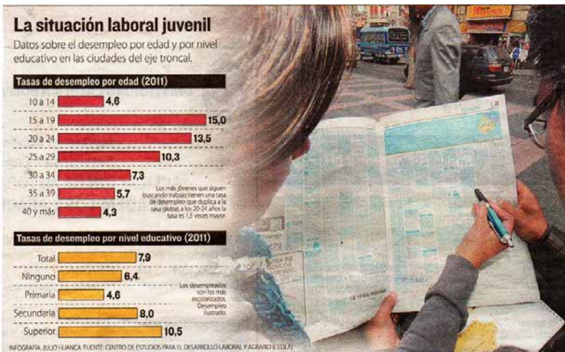
Gráfico 1 La situación laboral juvenil