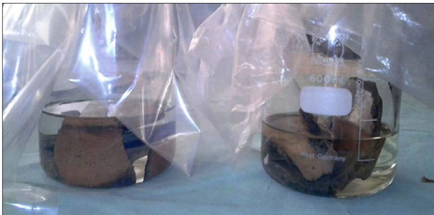
Figura 6: Tratamiento con Etanol, fragmentos sumergidos en la sustancia.