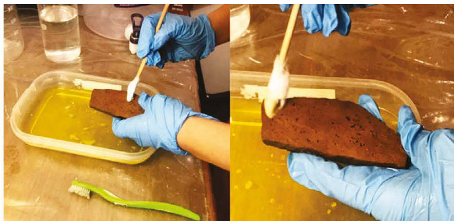
Figura 8: Procedimientos de remoción de los líquenes.