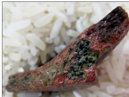
Figura 1: Un líquen de talo crustáceo vegetando sobre cerámica arqueológica.

En vista de que no se encontró en la bibliografía una guía de procedimientos para remover los líquenes de cerámica arqueológica, se ha visto conveniente escribir una reseña de la experiencia acumulada al emprender la tarea de limpiar de líquenes esta colección de alfarería. Se ha consultado a profesionales