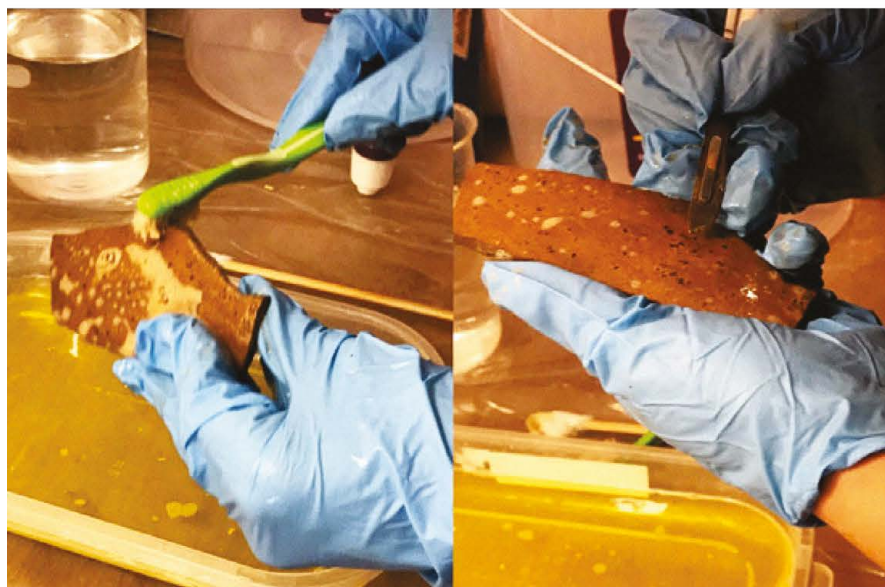
Figura 9: Se utilizó un cepillo y bisturí en la mayor parte de los casos.