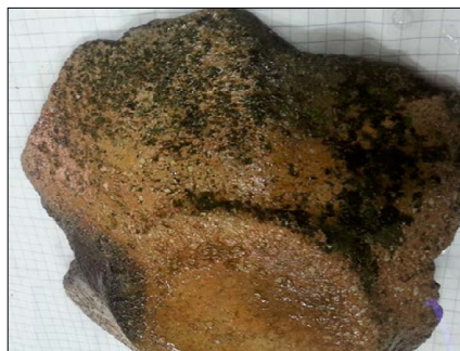
Figura 2: Líquen afectando la superficie de la pieza.