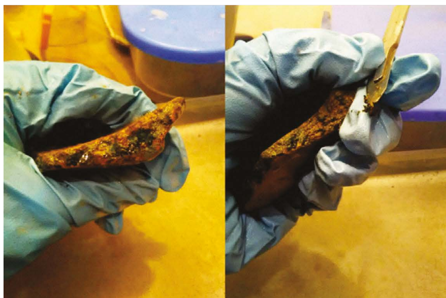
Figura 10: Líquenes crustáceos muy persistentes, removidos con bisturí.