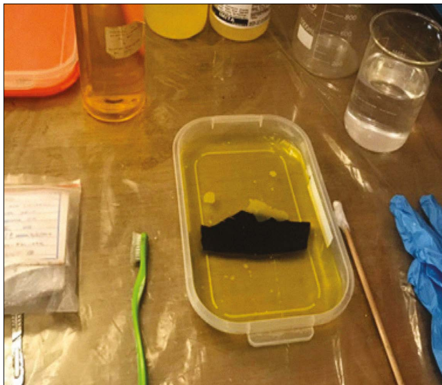
Figura 7: Fragmento de cerámica sumergido en \text{NH}_4 Cuaternario al 3%.

- El secado fue a la sombra, este duró durante varios días para cerciorarnos que los fragmentos tengan la menor humedad posible antes de ser guardados en bolsas de plástico.