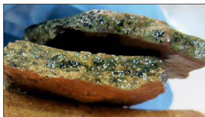
Figura 3: Líquen afectando el corte de los fragmentos de cerámica arqueológica.