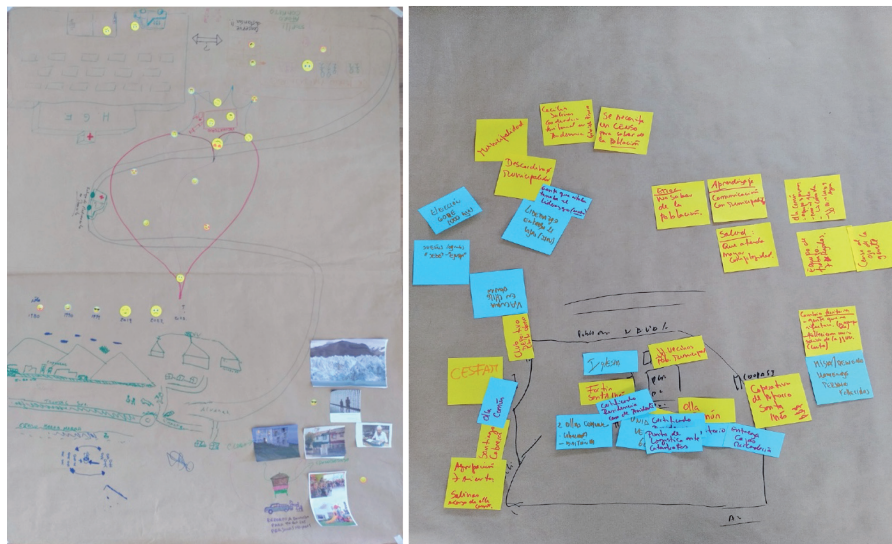
Figura 2. Cartografías Sociales de las Jornadas Cartográficas Expresivas

Nota: Cartografías Sociales de la Jornadas Cartográficas Expresivas elaboradas por participantes. En estas se representan las estrategias y tácticas de gestión de la pandemia COVID-19 desarrolladas en el periodo del estudio.