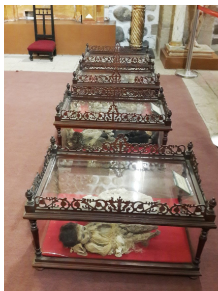
Figura 3. Urnas conteniendo los restos de niños encontrados durante actividades de restauración en San Bernardo. Actualmente se encuentran en el Museo de la Casa Nacional de Moneda.

Están resguardados en 4 urnas de vidrio no selladas (Figura 3). Si bien el ambiente frío y seco del museo coadyuva en cierta medida la preservación orgánica, es evidente que el deterioro hace mella de estos cuerpos. Los encargados de las salas del museo expresan su preocupación por la falta de contexto y ante todo por el lamentable estado de conservación de estos restos infantiles ya que son parte de la historia social y espiritual de Potosí y su exposición descuidada no coincide con los parámetros técnicos y éticos que requiere el manejo del patrimonio cultural material estipulado por leyes y normativas bolivianas.