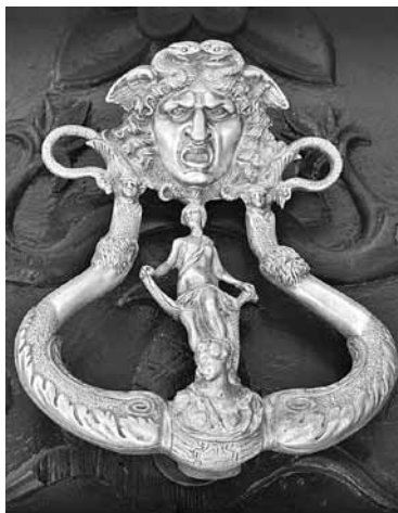
Sociedad Boliviana de Estudios Clásicos SOBEC

Revista de la Sociedad Boliviana de Estudios Clásicos Número VI